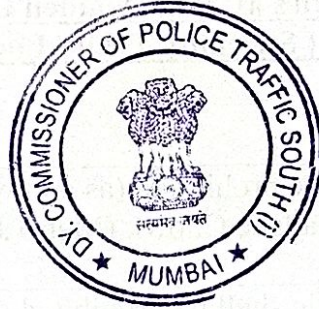
( Pradnya Jedge ) Dy. Commissioner of Police (South), Traffic, Mumbai.