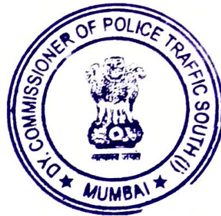
(Pradnya Jedge) Dy. Commissioner of Police (South), Traffic, Mumbai.